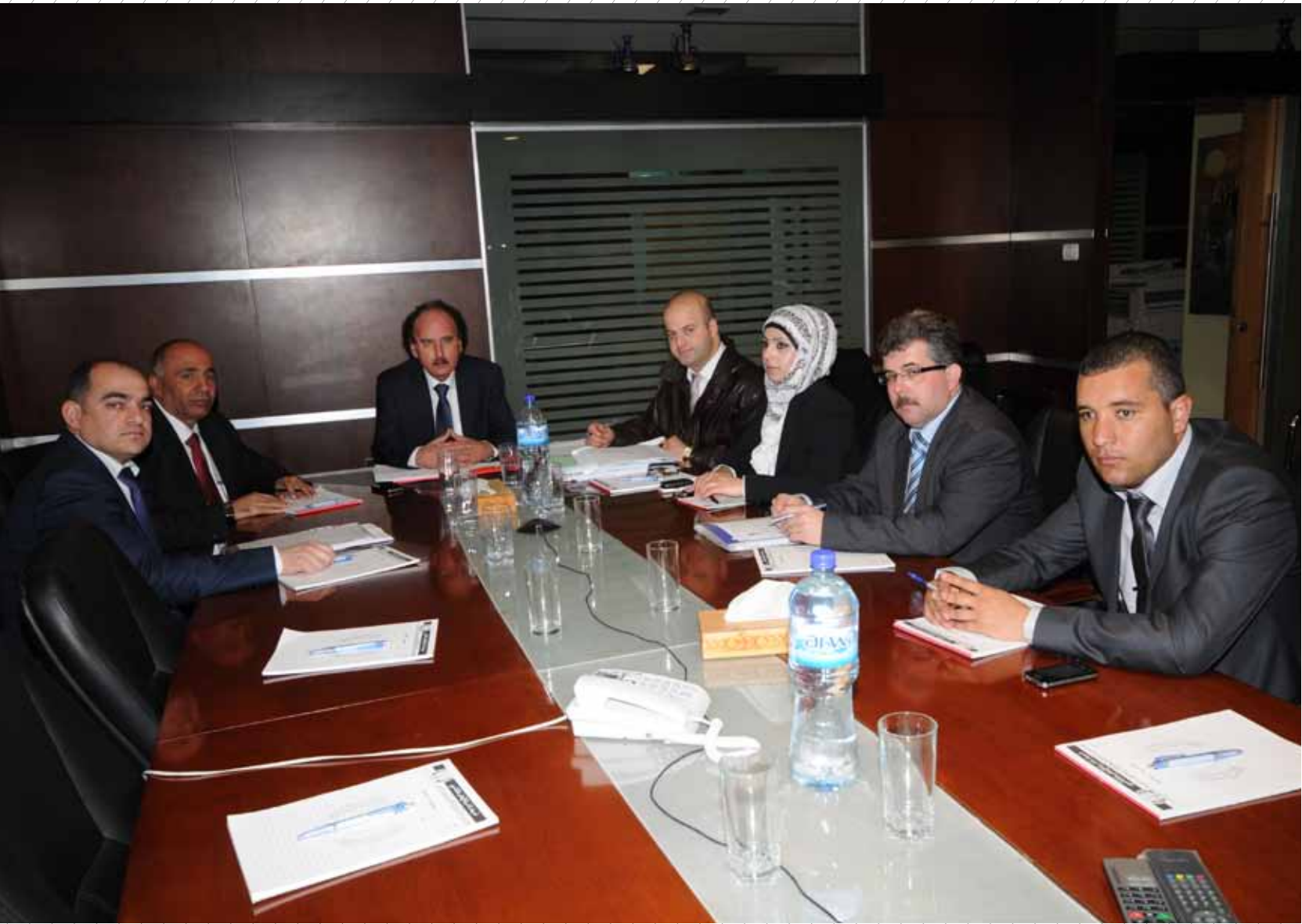
أعضاء الدائرة القانونية المركزية