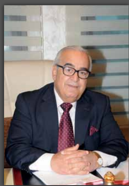
المؤسس الأول والرئيس التنفيذي للمجموعة الأهلية للتأمين